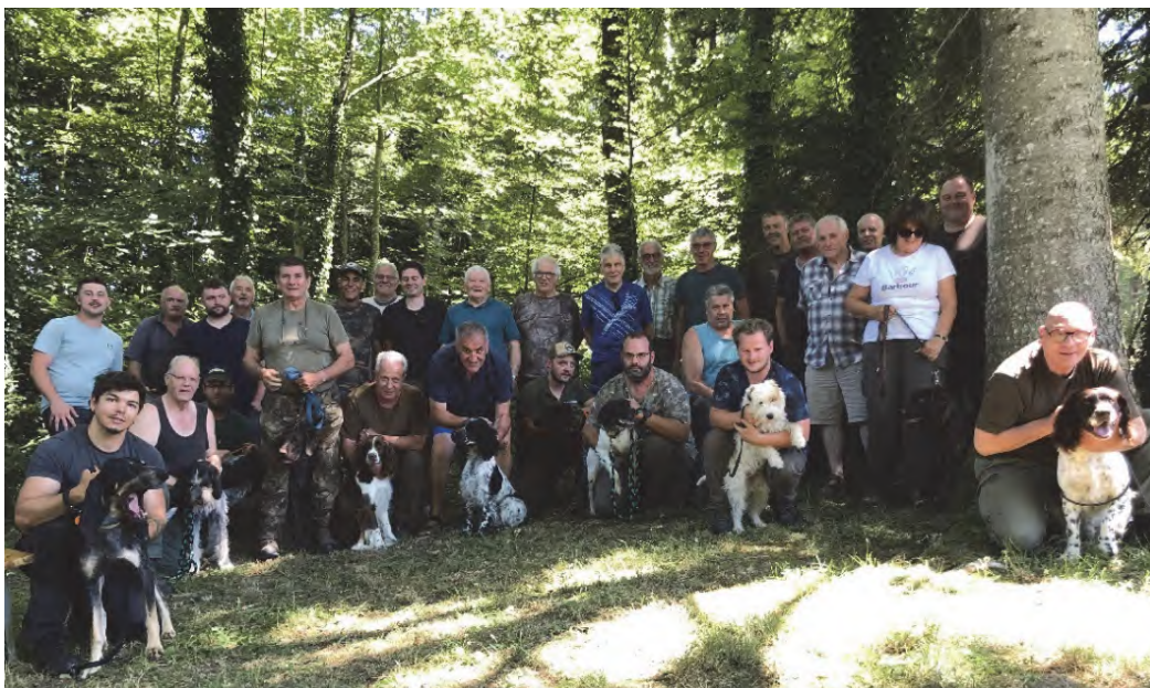
Participants aux épreuves 2025.

Les formations 2026 d'obéissance et de recherches au sang débuteront début avril. Toutes les informations seront disponibles sur le site internet et paraîtront également dans la newsletter.