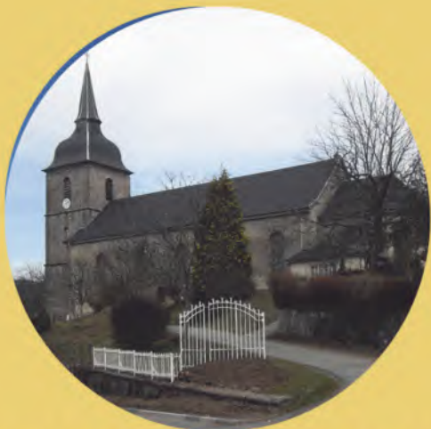
EGLISE DE ROUGEOUTTE (FRANCE) • À PARTIR DE 20 H