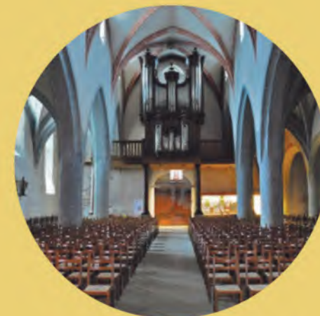
EGLISE ST-PIERRE À PORRENTRUUY (JURA SUISSE) • À PARTIR DE 20 H 15