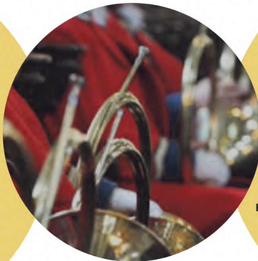
TROMPES, CHANTS, ORGUE